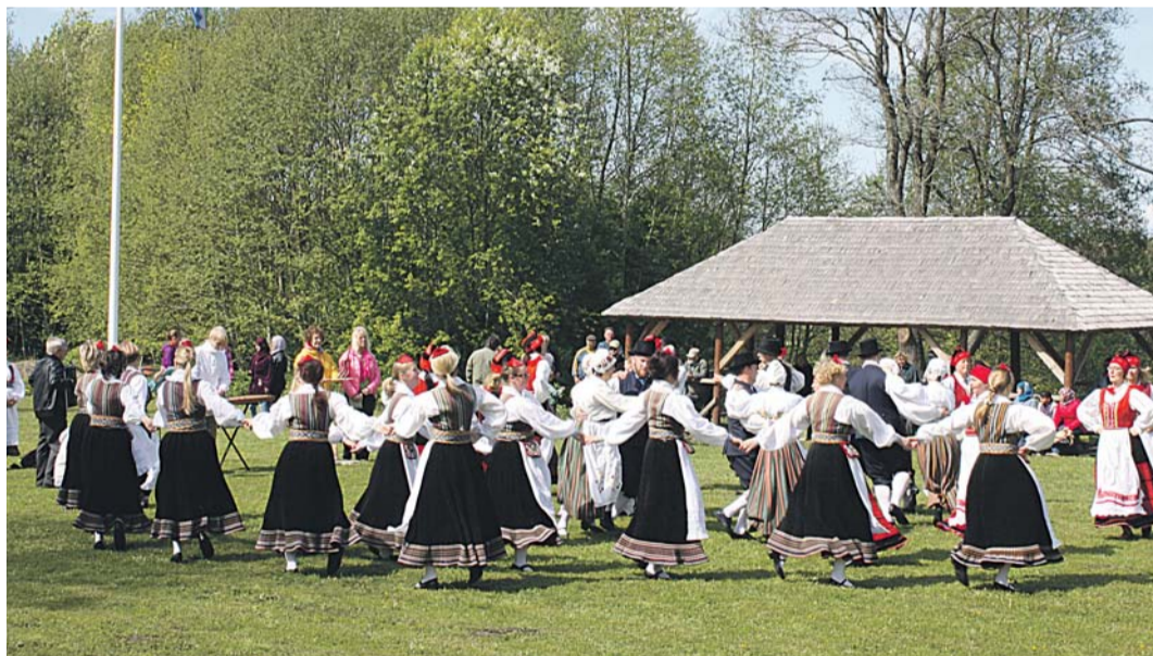
Ülgase külaplatsil tantsisid ansamblid "Kabujalakesed", "Viinikud" ja "Kirilind".