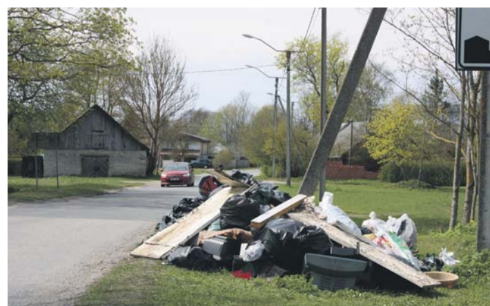
Kevadine prügiühnik Maardus.

Linnamäe hüdroelektrijaama võimsus on tänapäeval 1,15 MW ning aastane elektritootang ca 7000 MWh aastas, millest piisab aastas umbes 3000 Eesti perele. Linnamäe hüdroelektrijaama paisu kõrgus on ligi 12 ja laius 145 meetrit.