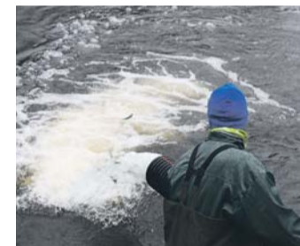
Eesti Energia lasi maikuu alguses Jägala jõkke 5000 lõhet.

vauimede äralõikamisega ning 500 kalal on lisaks individuaalmärgis.