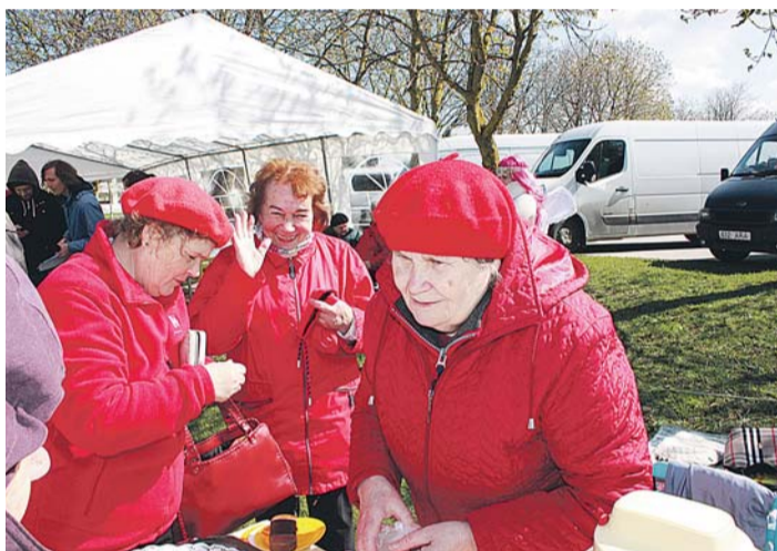
Loo Päeval lõi kaasa nii kohaliku kui muu valla rahvas.