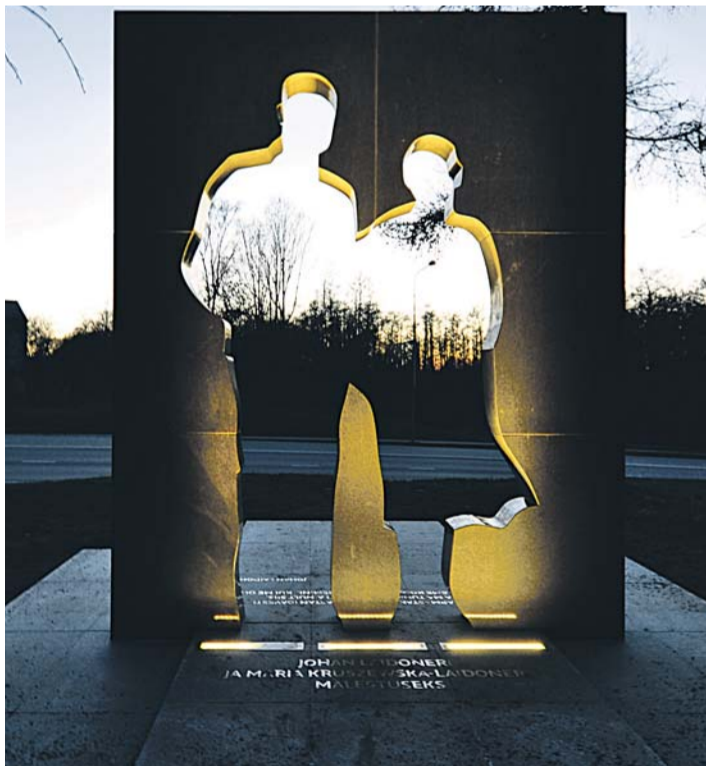
Johan ja Maria Laidoneri mälestusmärk "Taaskohtumine" on valmistatud mustast graniidist ning on nelja meetri kõrgune.

Lõpetuseks kinnitavad Juhan ja Maria, et nad on väga huvitatud erinevatel valda puudutataval planeeringute aruteludel osalemisest.