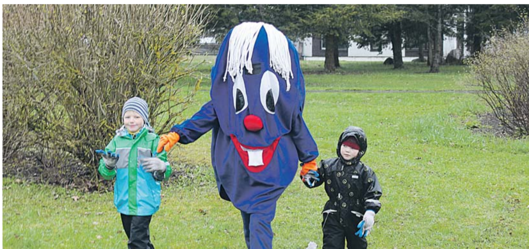
Lisaks emmedele-issidele asjatasid tegusalt ka aleviku pisemad.