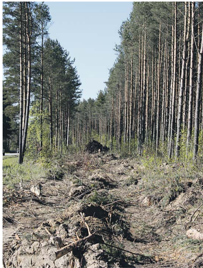
Metsasiht kergliiklustee rajamiseks on valmis.