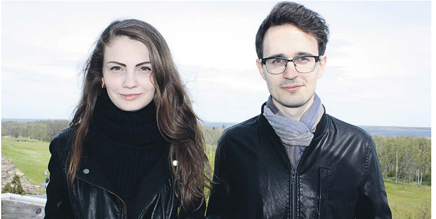
Juhan ja Maria õpivad Eesti Kunstiakadeemias arhitektuuri ja nende ühistööd on leidnud äramärkimist.

Viimsi vallaga oli hästi hea koostöö, mistõttu saime mälestusmärgi püsti aastaga. See