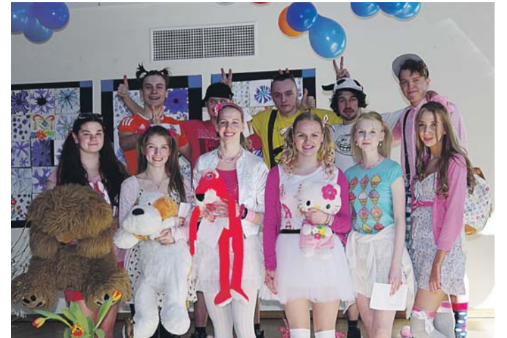
25. lennu tutipidu.

Täpsema info kooli sisseastumise kohta leiate Jõelähtme MKK kodulehelt joelahmememkk.ee.