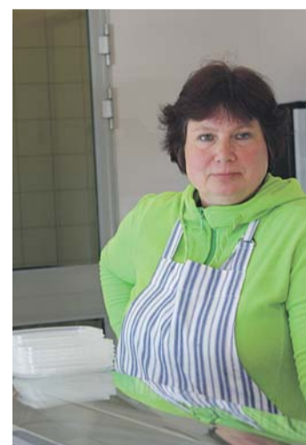
Eelmisel nädalal avati Loo kaubanduskeskuse hoones uus suur kalapood. Külmetis on värskes rääm, angerjas, koha, tursk, angergäga, lõhe, forell, karpkala, lisaks lai valik suitsukala ja marineeritud kalatooteid. Hinnad on soodsad ja kaup kvaliteetne. Küsimusele, kust kala püütud on, vastati lahkesti, et Peipsist, Võrtsjärvest, Läänemere ja kalakasvandustest.