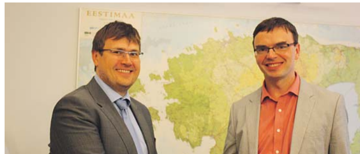
Jõelähtme vallavalitsus taotleb kaitseministeeriumilt Kuuse tn 4 kinnistul asuvat maja ja maad.

Sotsiaaleluruumi üürile andmise otsustab vallavalitsus.