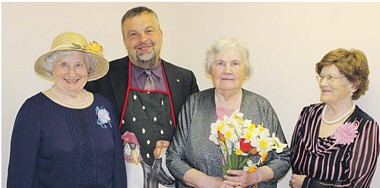
Näitetrupi 10. aastapäeval etendati lustakas lugu "Mis juhtus?".

Loo Päeval lõbusatas lapsi krutskeid täis Pipi Pikksukk. Väike, vallatu, abivalmis ja heatahtlik Pipi tegi näomaalinguid ja mängis lastega.