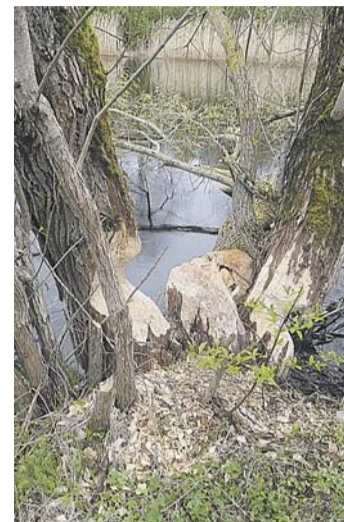
Kopraonu söögiplats Pirita jõe ääres, Loo aleviku lähialal, kus rahvas suplemas käib ja kalamehed ussi loevad. Loo Vesi töömehed likvideerisid ohtlikud puud.